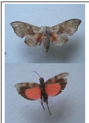
Analogie: Flügelform, -farbe und Augenflecke beim Schmetterling (Pappelschwärmer) und der Roten Ödlandschrecke

Im Gegensatz zu Homologien handelt es sich bei analogen Merkmalen um unabhängig voneinander entstandene strukturelle Übereinstimmungen bei nicht näher verwandten Taxa . Dies kann durch eine ähnliche Lebensweise begründet sein wie beispielsweise die grabschaufelartig gestalteten Vorderextremitäten bei Maulwurf und Maulwurfsgrille, die beide im Boden leben. In diesem Fall ist die Analogie als „Antwort“ auf bestimmte Bedingungen in der Umwelt zu verstehen.