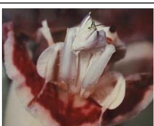
Mimese UND Mimikry: Hymenopus coronatus

Das Problem der Abgrenzung von Mimikry und Mimese bzw. die nicht immer mögliche eindeutige Zuordnung zu einem Begriff macht das Beispiel der tropischen Fangschrecke Hymenopus coronatus deutlich. Sie imitiert die